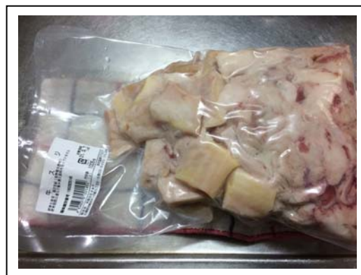
充填写真撮り忘れ